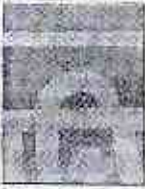
Bikram Singh AFP

BLACK MONEY BY D SHAN DEN DEMONETISATION MOVE